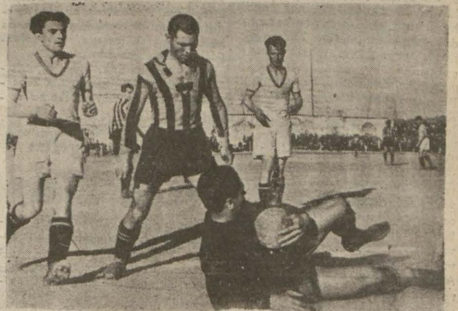
Dünkü maçtan bir izniba (Yazısı 4/2 de)