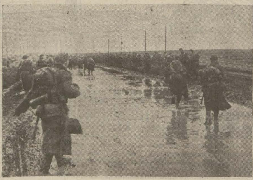
Asfalt değil, çamur: Şark cephesinde yollar bugün hâlâ bu haldedir!

Bir müddet evvel, yüz binlerce liralık servetini Türk ordusuna hibe eden merhum prenses Neveivanın zevci Feridun Paşa Kırıkkalede yapılacak bir amele hastanesi için 50 bin liralık bir teberrüde bulunmuştur. Feridun paşanın bu insani hareketini memnuniyet ve takdirle yazarken, bu hareketin bütün zenginlerimize bir nümune imtisal olmasını temenni ederiz.