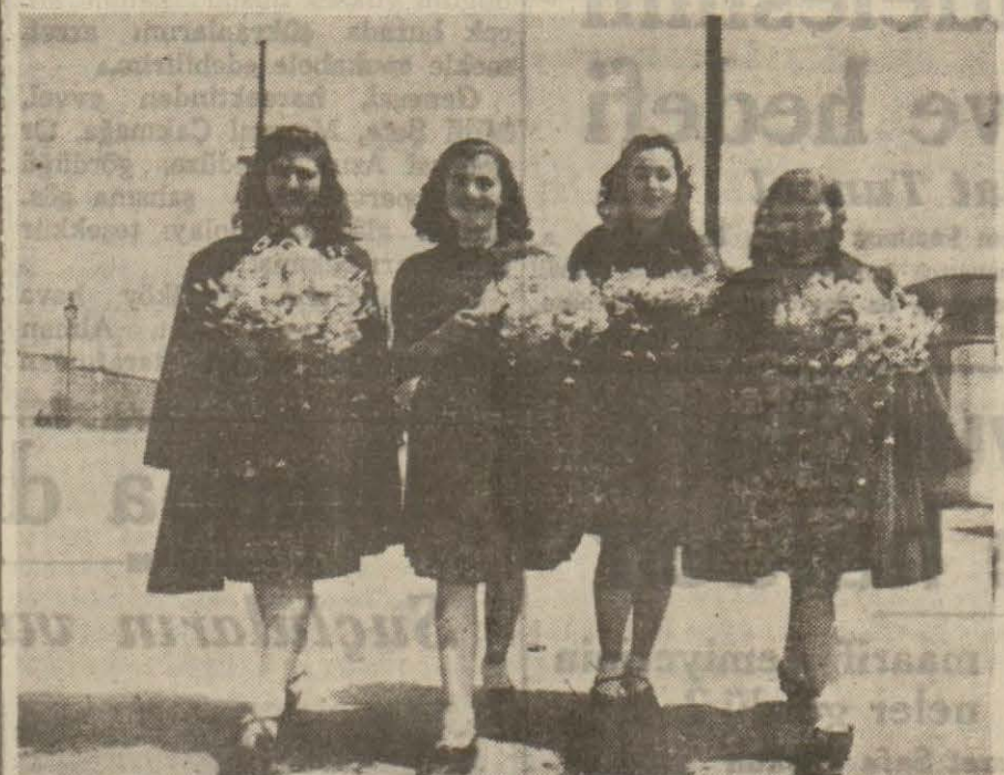
Kürtajdan önce genç kızlar

Dün, sabahleyin havanın kapalı olmasına rağmen, tatilden istifade eden İstanbullular hava almak ü- zere mesire yerlerine akin atmış- lardır. Bilhassa Boğaz ve Ada va- pularında kalabalık göze çarptır- yorlardı.