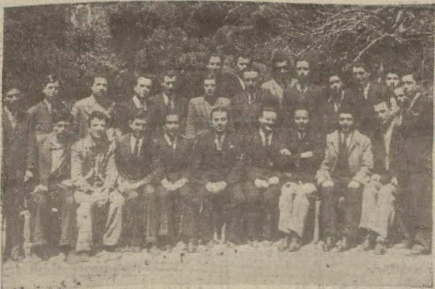
Maarif Cemiyeti Talebe yurdundaki gençlerden bir kısmı sızı tozlu, topraklı koskoca bir meydanın ortasına bırakır. Burası Kadirga (Devamı 4/1 de)